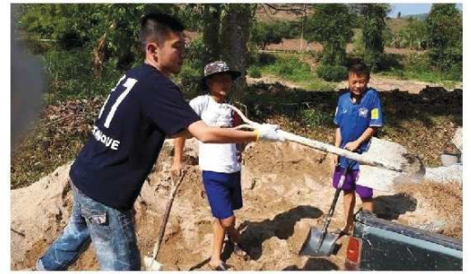
メーコック財団にてボランティア活動