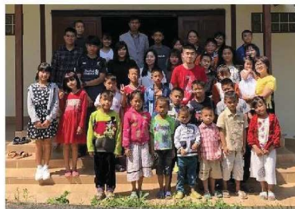
メーコック財団の子供たちと