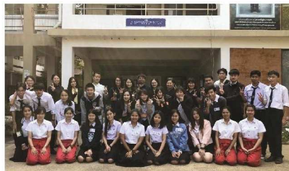
ラチャパット大学の学生と交流