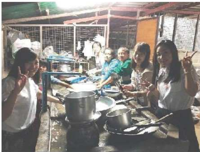
子供たちと食器の片づけで交流

平成30年2月20日から3月1日までの10日間、第14回のスタディツアー（行先：タイ王国）を開催しました（参加者6名）。当協会が長年支援してきたタイ北部のメーコック財団（※1）や、ルンアルン（暁）プロジェクト（※2）に主に滞在してタイの文化に触れ、子供たちとの交流や様々なボランティア活動を行いました。麗澤大学の4名の参加者にとって、それぞれが将来の自分に何ができるかを考える貴重な機会となり、たいへん意義深い旅となりました。