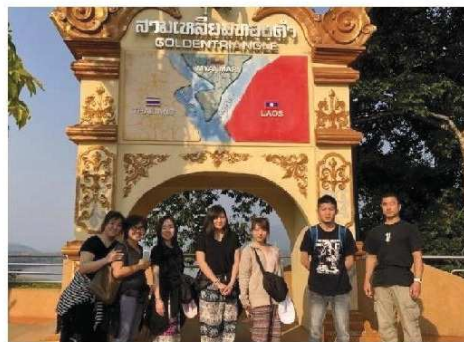
ゴールドトライアングルにて