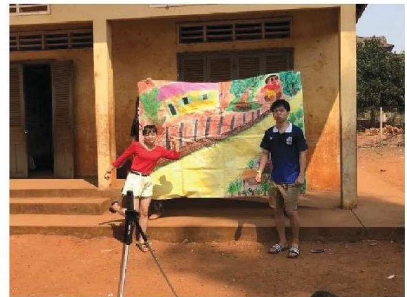
手応えを感じたカンボジア語劇