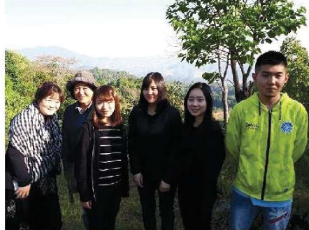
「暁の家」が所有しているコーヒー農園にて