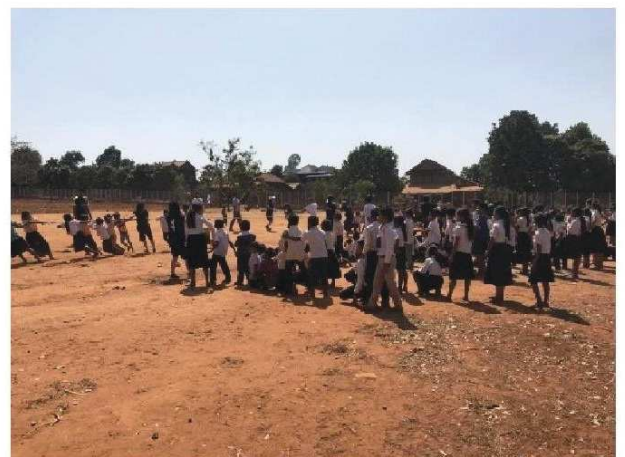
「綱引き」では一体感も生まれた