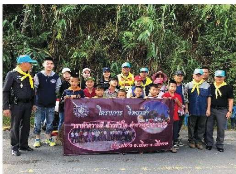
メーコック財団の子供たちとボランティア活動

麻薬の問題を身近に感じることもできたが、それを感じさせないほどタイ人はフレンドリーで明るくて、子供たちもみんな笑顔で、10日間という短い滞在期間ではあったが、タイという国はこんなにも温かく日本人には優しい国だと感じる事ができ、またすぐにタイに行きたいと思えるようなとても良い期間だった。