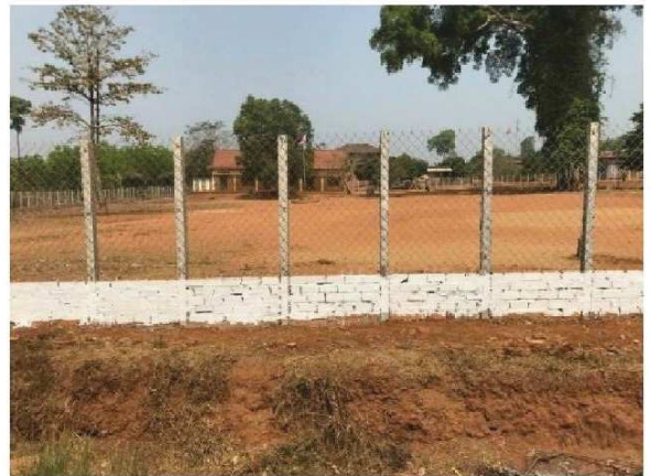
完成した塀の一部

カンボジアのコンポントム州トム・オー村で唯一の小学校であるトム・オー小学校は、平成20年（2008）に麗澤海外開発協会（以下 RODA）の資金援助によって建設されました。この小学校には約180名の生徒が通っていますが、過去の調査から校庭内にバイクや車が侵入し、子供たちが安全に安心して運動等ができないことが判明しました。そこで、トム・オー小学校に通う子供たちが安心して過ごすとともに安全な環境で学べるためのプロジェクトを考案し、小学校の四方を囲う頑丈な塀を建設することになりました。