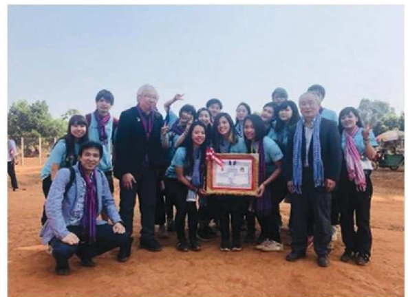
RODAの方々といっしょに