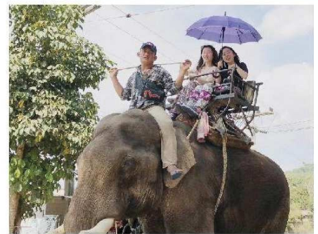
ラフ族の村で象乗り体験