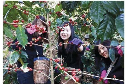
コーヒー豆の収穫体験